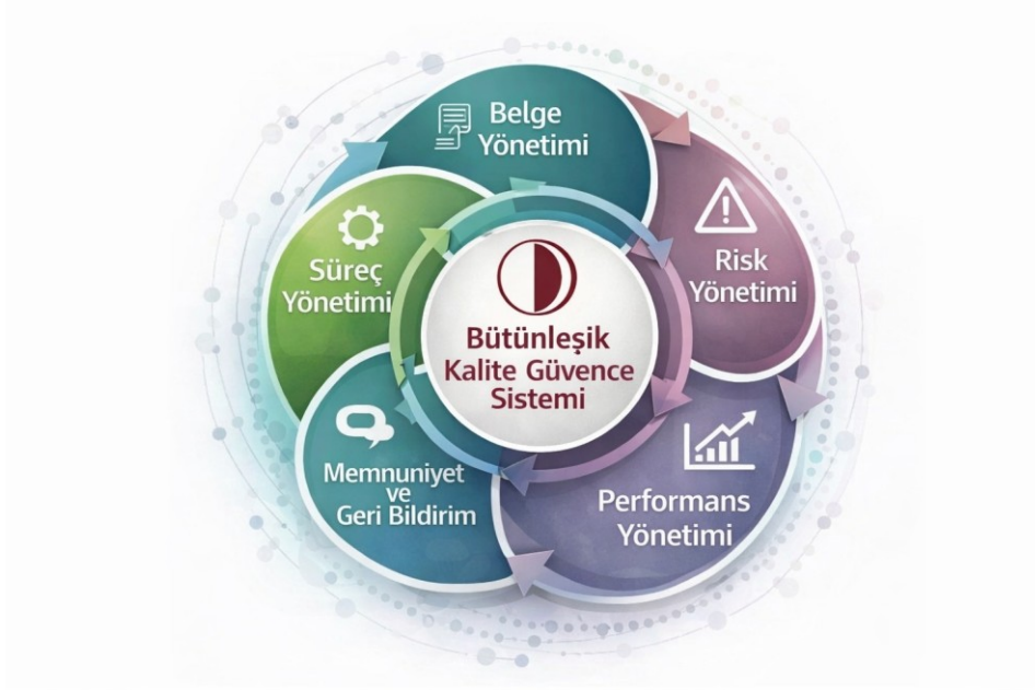
Şekil 4.1.1 Yakın Doğu Üniversitesi Bütünleşik Kalite Güvencesi Yönetimi Modeli

Yakın Doğu Üniversitesi Bütünleşik Kalite Güvencesi Yönetimi; eğitim-öğretim, araştırma-geliştirme, toplumsal katkı ve yönetim süreçlerinin kalite güvencesi ilkeleri doğrultusunda planlanması, uygulanması, izlenmesi ve iyileştirilmesini kapsayan bütüncül bir yönetim yaklaşımına dayanmaktadır. Sistem, stratejik yönetim, süreç yönetimi, performans yönetimi ve risk yönetimi bileşenleri ile PUKÖ döngüsü temelinde yürütülmektedir.